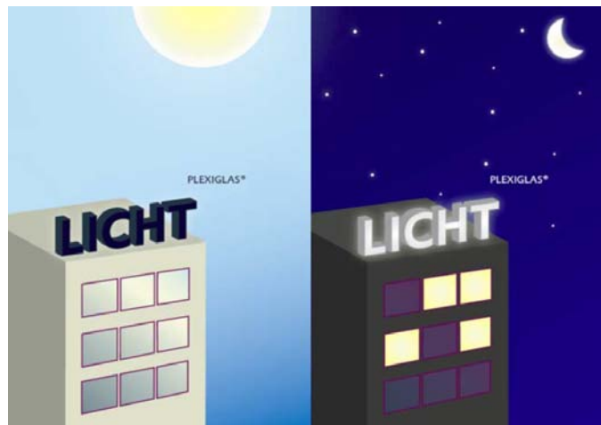
2. kép Megjelenés napfényben és éjszakai megvilágítás esetén