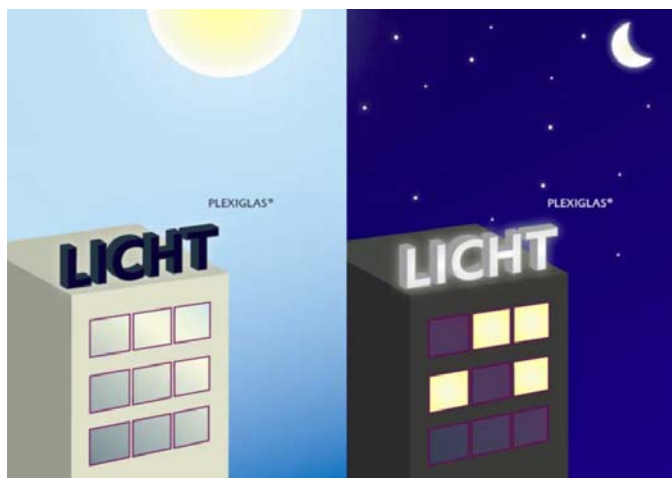
2. kép Megjelenés napfényben és éjszakai megvilágítás esetén